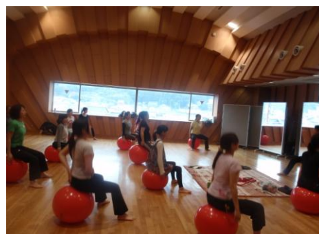
産後のリハビリ&バランスボール エクササイズ講座