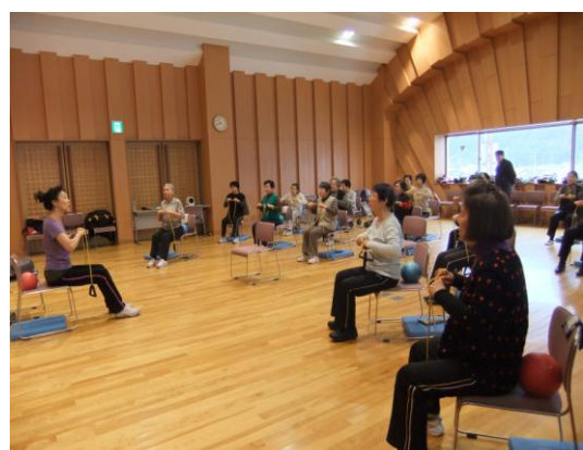
ワンコイン講座健康体操 すわろビクス