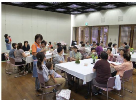
プラザサロン「にこにこ」