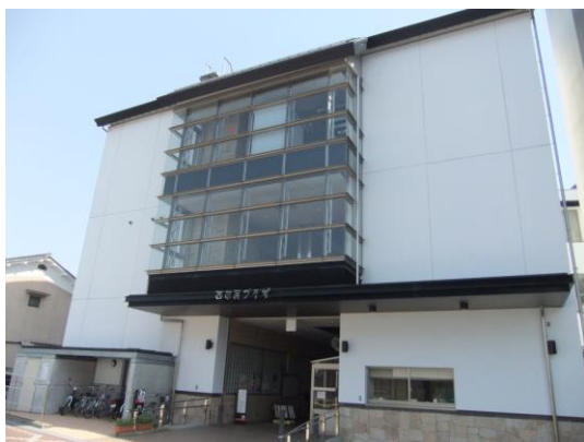
舞鶴西市民プラザ

できるだけ多くの皆様に、利用しやすい施設運営を目指すため、施設が持つ機能や特徴を活かし、交流と活動の拠点整備に取り組むことで、地域に賑わいを創出し、地域経済の活性化に繋がることを目的としています。