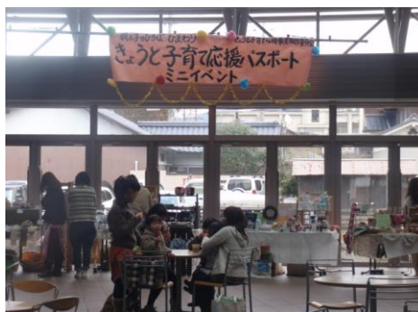
きょうと子育て応援パスポート ミニイベント