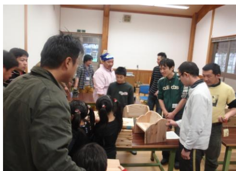
あこがれお父さんプロジェクト