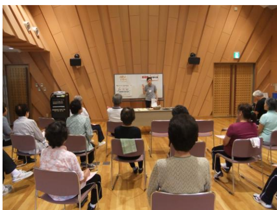
高齢者生き生きトレーニング