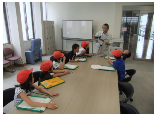
明倫小学校 社会見学