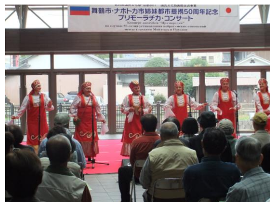
プリモーラチカ・コンサート