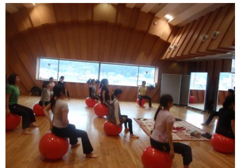
産後のリハビリ&バランスボール エクササイズ講座