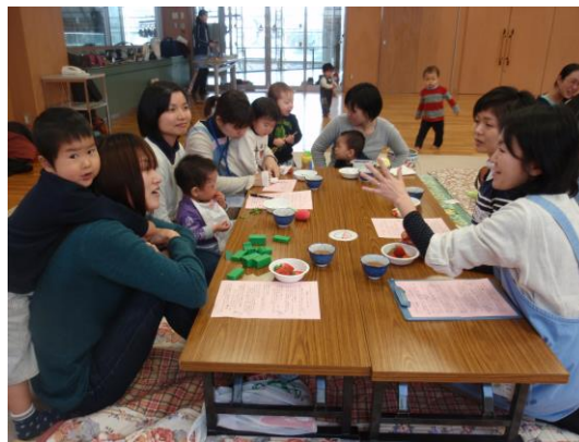
カンガルーママ広場