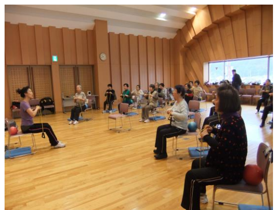
ワンコイン講座健康体操 すわろビクス